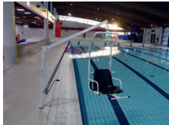
Siège dur en option