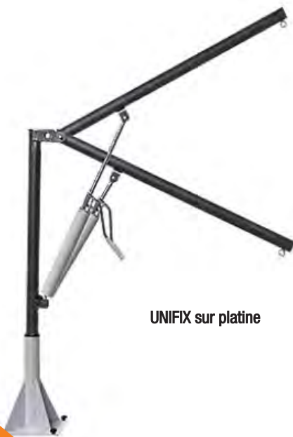
UNIFIX sur platine